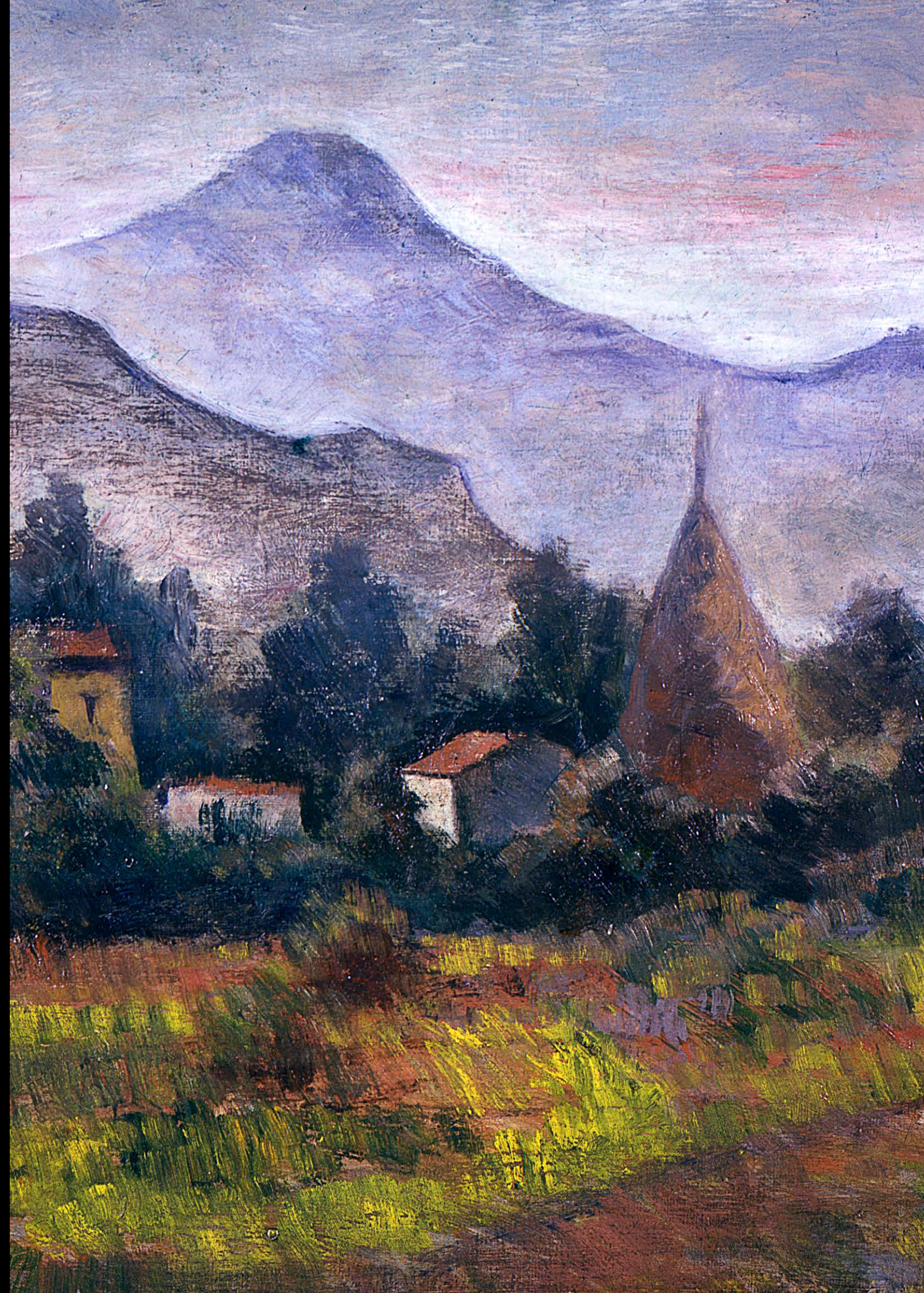
Ieri, oggi e domani - Un itinerario di Carlo Carrà in Versilia

Finito di stampare nel mese di giugno 2020 per conto dell'Ente Ville Versiliesi dalla tipografia Bendecchie & Vivaldi, Pontedera (PI)